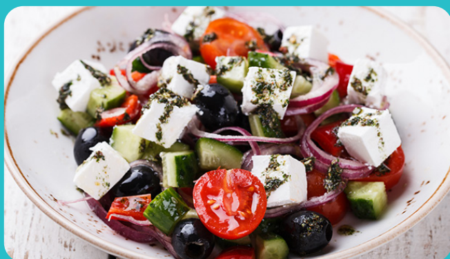
Salade Grecque + Sardines