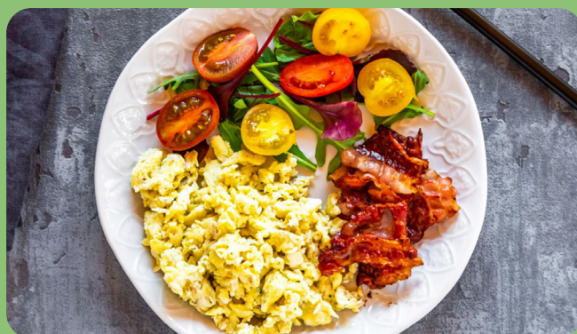
Oeufs brouillés + Bacon + Tomates cerise