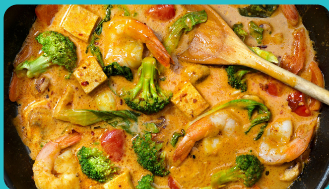
Curry de crevettes + Légumes au lait de coco