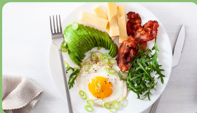
Œuf au plat + Jambon + Fromage + Avocat