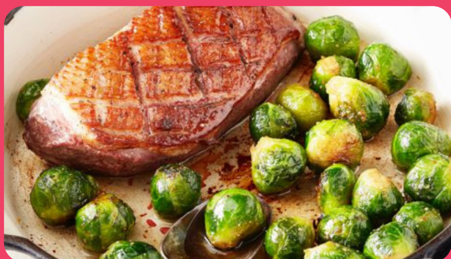
Magret de canard + Choux de Bruxelles