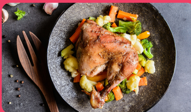
Poulet rôti + Chou-fleur + Brocolis + Carottes