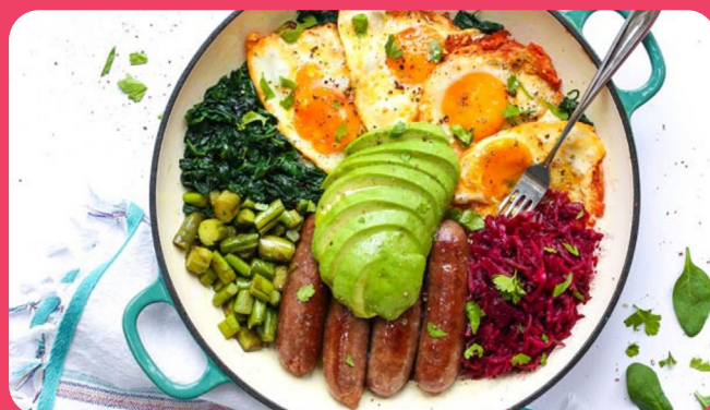
Œufs plat + Avocat + Épinards + Saucisses + Chou Rouge