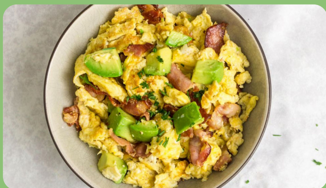
Oeufs brouillés + Avocat + Bacon