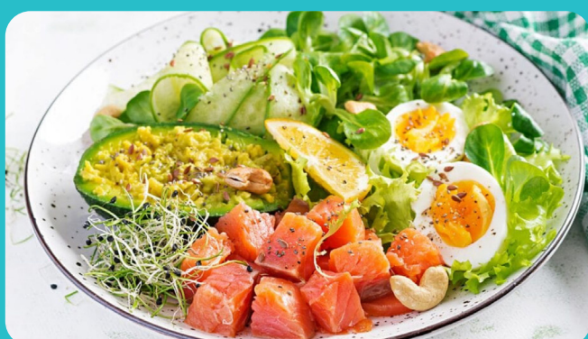
Saumon cru + Avocat + Oeuf + Salade + Courgettes