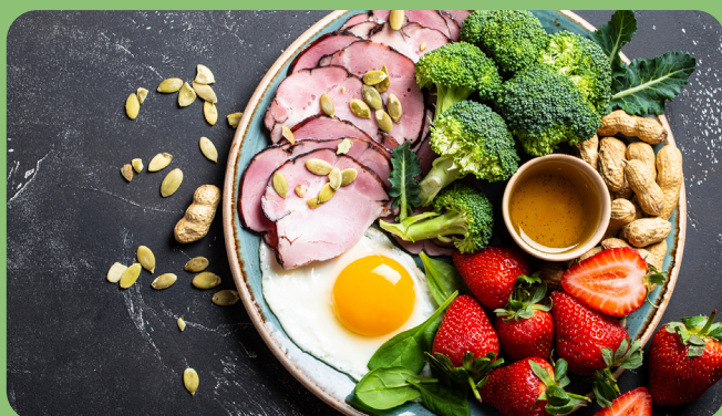
Oeuf plat + Jambon + Brocolis + Cacahuètes + Fraises + Huile de Colza