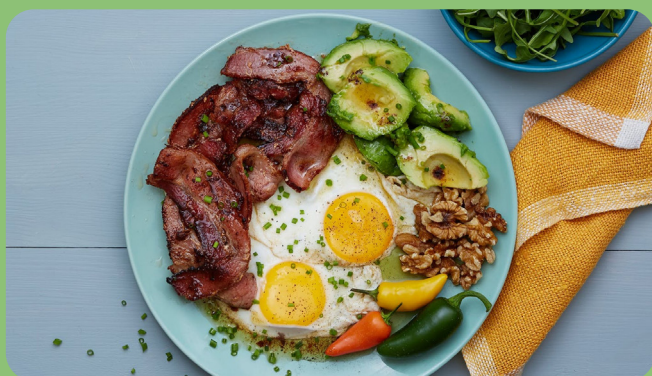
Bacon + Avocat + Noix + Oeuf plat