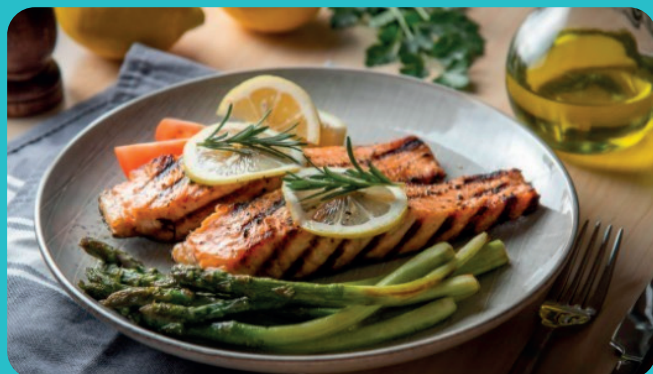
Pavé de Saumon + Asperges