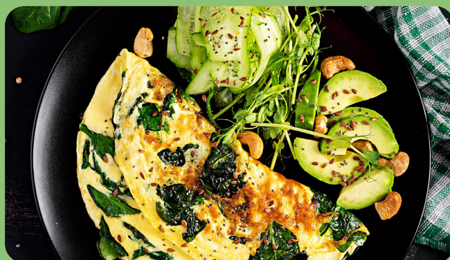
Omelette épinards + Avocat + Courgettes + Noix de cajou